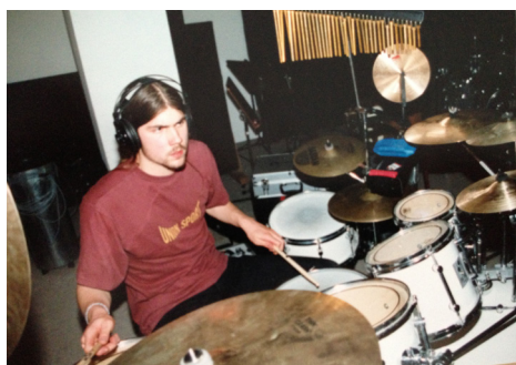
1995: Modern Music School Student