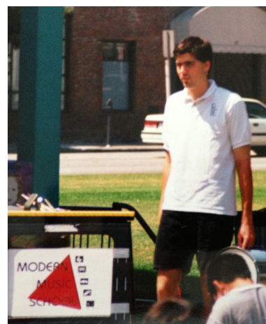
1998: School Manager Modern Music School Los Angeles